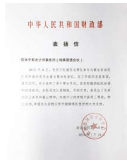
财政部评审中心表扬信

为国为民”的锦旗是北京朝阳剧场安全升级装修改造工程委托方——北京朝阳剧场于2016年1月7日赠送给信永中和工程造价北京总部的。它不仅真诚的表达了委托方对信永中和、对项目组成员的谢意，也凸显了造价