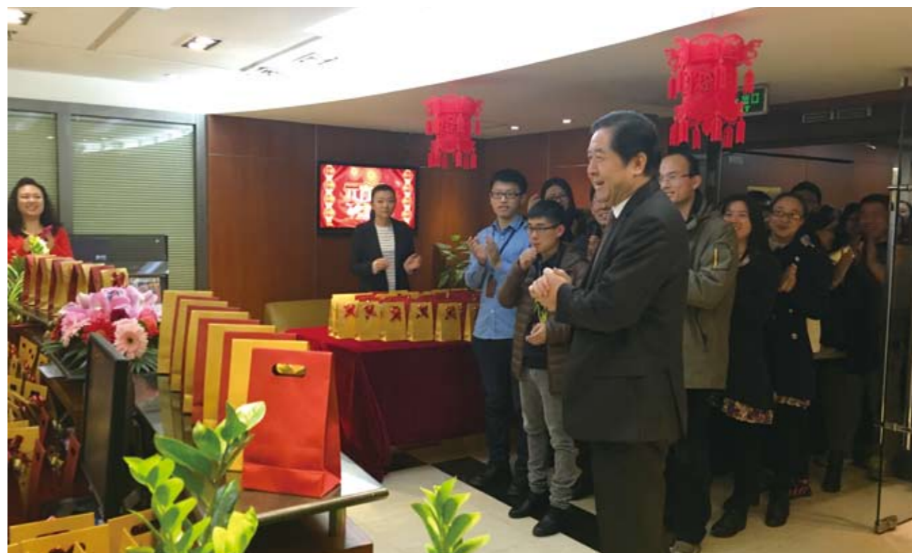
元宵佳节信永中和举行员工迎春送福活动

合羊辞旧岁，猴迎新年！在这欢庆的日子里，祝信永中和大家庭的每一位员工新年吉祥！祝信永中和再创辉煌！