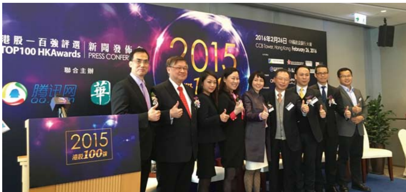
信永中和再度担任「港股 100 强」2015 专业顾问

2016 年 1 月 12 日，中共成都市注册会计师行业委员会赴彭州市蓝天小学开展现场捐赠活动。信永中和成都分部与中兴华、天职国际、大信、瑞华、天健、科达信等 8 家会计师事务所代表及市慈善总会代表参加现场捐赠活动。本次捐赠，对 6 名孤儿按每人 5000 元标准、9 名贫困学生按每人 4000 元标准一次性发放助学金，共计 66000 元。