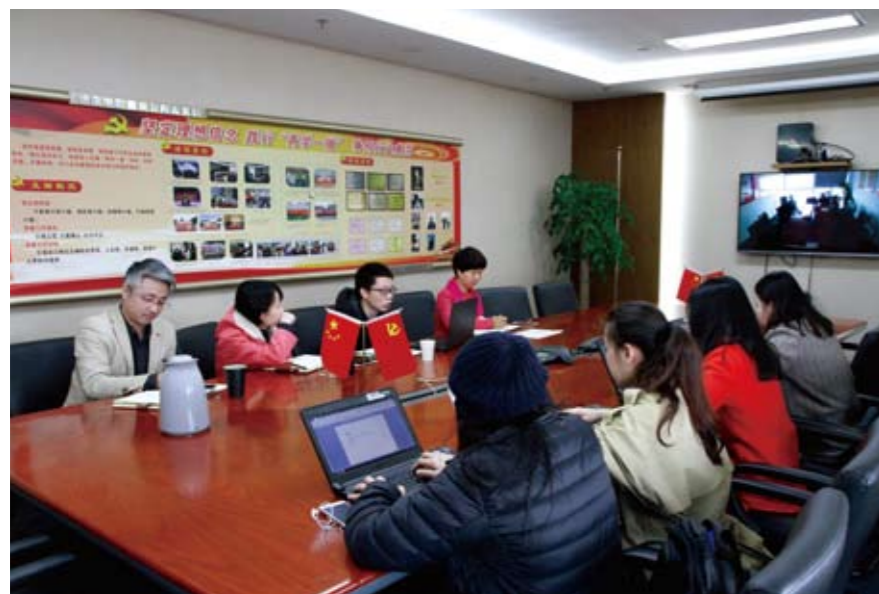
信永中和被财政部预算评审中心选定为绩效评价项目服务机构