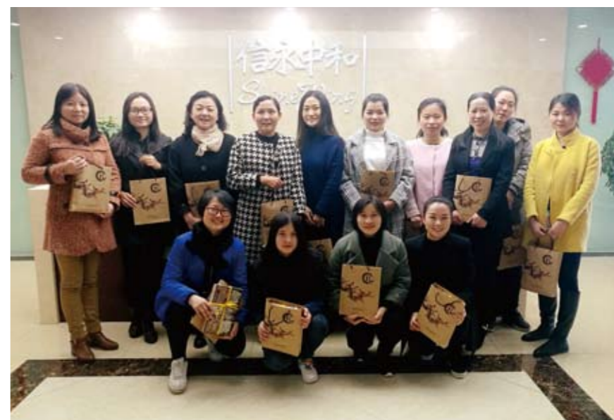
“三八”国际劳动妇女节信永中和合肥分部合伙人慰问女员工

自尊、自信、自立、自强的精神，发挥“巾帼不让须眉”的风采，勤奋学习，努力工作，为营造温馨家庭、构建和谐社会，再做贡献、再创佳绩！