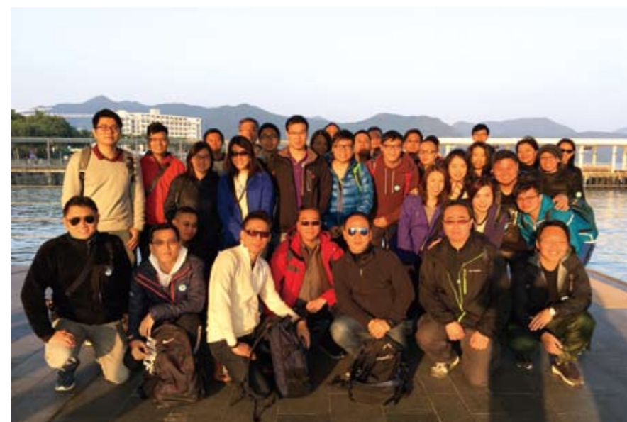
■ 信永中和香港举办生态旅游