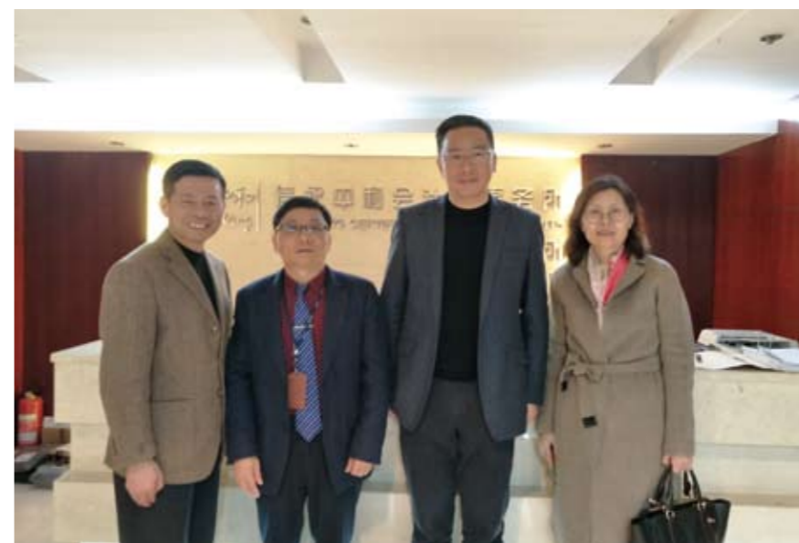
福州市鼓楼区人大常委会主任走访福州分部