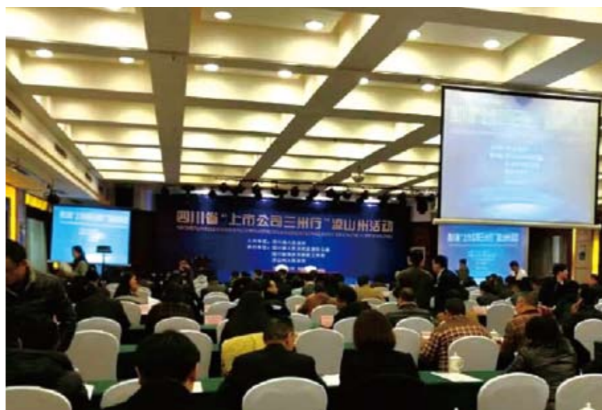
成都分部参加四川省“上市公司三州行”活动