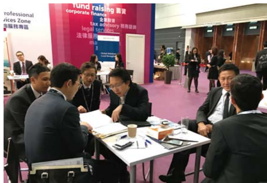
■ 信永中和参与亚洲金融论坛 Deal Flow 环球投资项目对接会

由香港特别行政区政府及香港贸易发展局合办的亚洲金融论坛 (Asian Financial Forum, AFF)，已于2017年1月16日至17日在湾仔香港会议展览中心顺利举行。