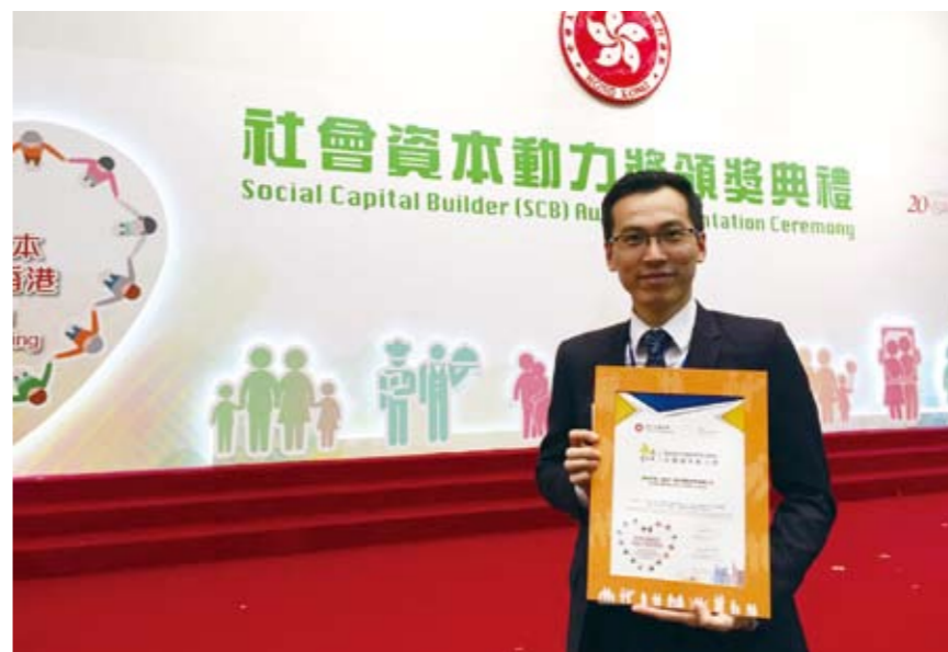
■ 信永中和香港获劳工及福利局社区投资共享基金颁发社会资本动力标志奖

为与会者提供实时的专业咨询服务。AFF Deal Flow 是一个将资金和投资项目作出配对的活动，当日超过160名投资者参加对接会，其中近半来自中国，涉及300多个来自世界各地的投资项目。信永中和的审计及商业咨询、财务咨询、税务咨询及咨询专项服务的专家分别出席活动。