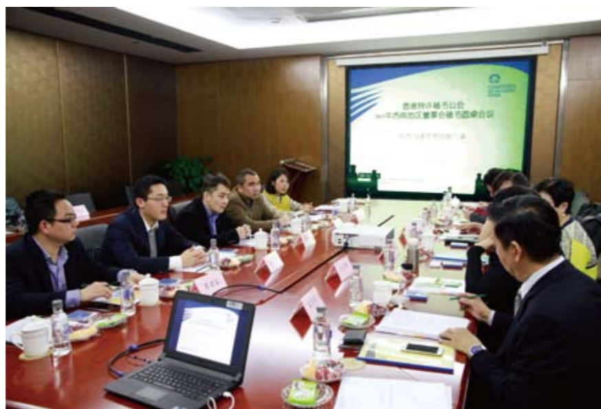
重庆分部举办香港特许秘书公会 2017年西南地区董事会秘书圆桌会议

经过座谈、交流以及现场参观，加深了来宾们对信永中和集团现代化、规范化、标准化的一体化管理方式的认可和信任，来宾们纷纷表示今后争取创造条件寻求商机与信永中和合作。重庆分部热情周到的接待与服务，得到与会嘉宾的好评与感谢。